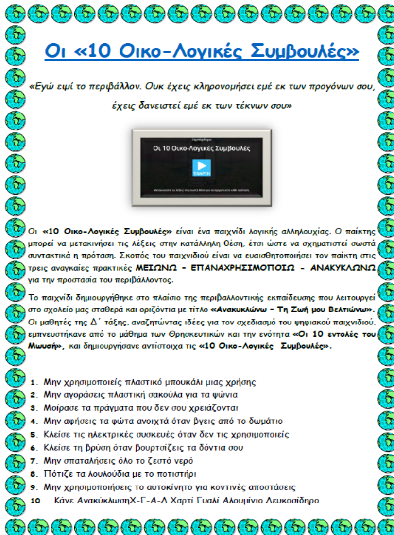
Εικ.1 Συμμετοχή 1 ου Δημοτικού Σχολείου Λαμίας «Οι 10 Οικο-Λογικές Συμβουλές»