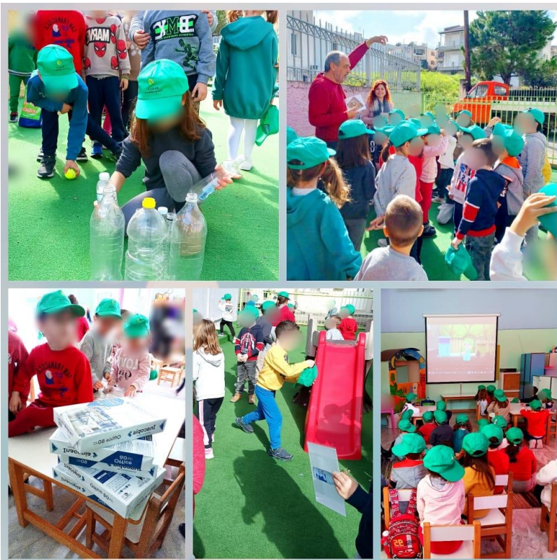
Εικόνες : Από επισκέψεις ΦοΔΣΑ σε σχολεία

Στο πλαίσιο της σχολικής ενημέρωσης - ευαισθητοποίησης, ο ΦοΔΣΑ Στερεάς Ελλάδας, στην αρχή του σχολικού έτους 2022-2023 , είχε προκηρύξει διαγωνισμό καλύτερης κατασκευής με ανακυκλώσιμα υλικά στον οποίο δήλωσαν συμμετοχή σχολεία από όλη την Περιφέρεια Στερεάς Ελλάδας και διακρίθηκαν 7 κατασκευές τους, οι οποίες ήταν ιδιαίτερα πρωτότυπες και ευφάνταστες. Τα αντίστοιχα σχολεία παρέλαβαν ως δώρο από τον Φορέα, ένα σετ 4 κάδων διαφορετικών χρωμάτων: μπλε (για γυαλί), κόκκινο (για πλαστικό & μέταλλο), κίτρινο (για χαρτί & χαρτόνι), πράσινο (για τα σύμμεικτα), ώστε να προωθηθεί η χωριστή διαλογή των αποβλήτων στην πηγή τους.