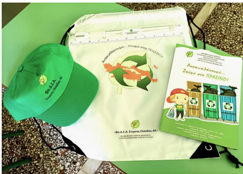
Εικόνα : «Αναμνηστικός σάκος» ΦοΔΣΑ

Για τις ανάγκες των δράσεων ενημέρωσης – ευαισθητοποίησης ο ΦοΔΣΑ έχει προμηθευτεί σχετικό εκπαιδευτικό υλικό (π.χ. μικρούς κάδους, διαδραστικά παιχνίδια, κ.λ.π.), ενώ επίσης έχει εκπονήσει τον «αναμνηστικό σάκο», που περιλαμβάνει ενημερωτικό έντυπο, υφασμάτινο καπέλο, στυλό και χάρακα με το λογότυπο του Φορέα, που διανέμεται σε όλους τους συμμετέχοντες μαθητές και εκπαιδευτικούς σε κάθε επίσκεψη ενημέρωσης – ευαισθητοποίησης σε σχολεία.