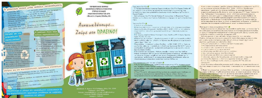
Εικόνες : Έντυπο ΦοΔΣΑ

Με μια ευρεία γκάμα βιωματικών και διαδραστικών δράσεων, με προβολές και παιχνίδια, οι μαθητές έχουν τη δυνατότητα να έρθουν σε επαφή με διάφορα περιβαλλοντικά προβλήματα που απειλούν τον πλανήτη και με πρακτικές προσαυσιές του περιβάλλοντος και ορθολογικής διαχείρισης των απορριμμάτων,