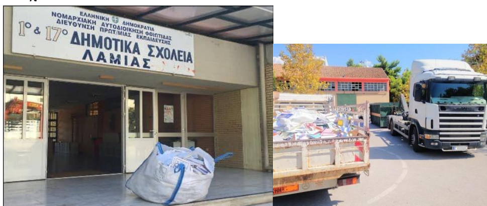
Εικόνες : Συλλογή χαρτιού – Πρόγραμμα «Διόφαντος»

Το πρόγραμμα αυτό, υλοποιείται με την παροχή μεγασάκων και χαρτόκουτων στα σχολεία της Πρωτοβάθμιας και Δευτεροβάθμιας Εκπαίδευσης της Περιφέρειας Στερεάς Ελλάδας, προκειμένου να συγκεντρωθούν σε αυτούς βιβλία, μαθητικά τετράδια και χαρτί-χαρτόνι από τους μαθητές. Στη συνέχεια ο Φο.Δ.Σ.Α. Στερεάς Ελλάδας ΑΕ ανέλαβε την συλλογή και μεταφορά των προς ανακύκλωση σχολικών βιβλίων από τα σχολεία στους κατά τόπους ΧΥΤΑ προορισμού, όπου βρίσκονταν τα ειδικά κοντέινερ για την συγκέντρωσή τους. Τέλος, ο ΔΙΟΦΑΝΤΟΣ παρέλαβε τη συγκεντρωμένη ποσότητα σχολικών βιβλίων (περίπου 60 τόνους το 2023) και μετά την ανακύκλωσή τους επέστρεψε τα έσοδα, μέσω του Φο.Δ.Σ.Α, στα σχολεία, με τη μορφή φωτοτυπικού χαρτιού με σκοπό την κάλυψη αναγκών των σχολείων που συμμετείχαν.