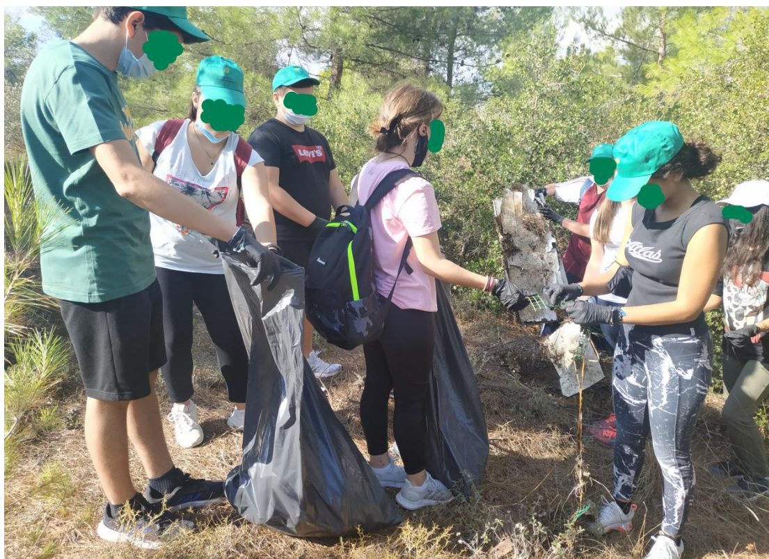
(Εικόνα : Καθαρισμός Δάσους Μοσχοποδίου)

Η προώθηση καλών πρακτικών, όπως οι εθελοντικοί καθαρισμοί χώρων και αλσουλίων (π.χ. καθαρισμός δάσους Μοσχοποδίου Θηβών, 2021)