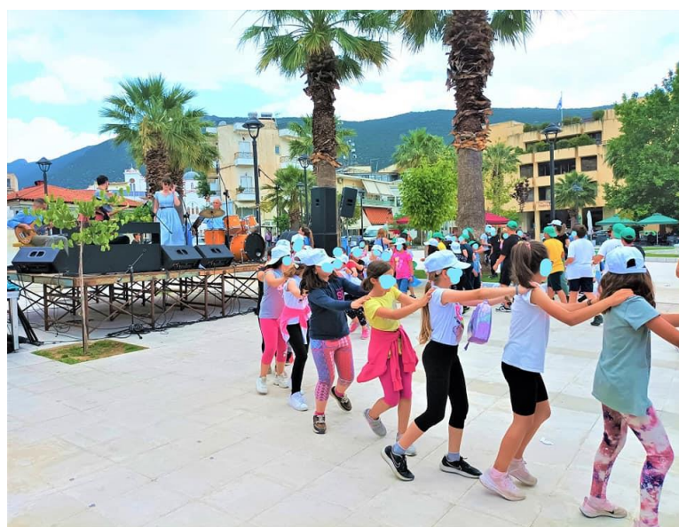
Εικόνες : Από εκδηλώσεις στη Σπερχειάδα, στη Θήβα και στην Άμφισσα