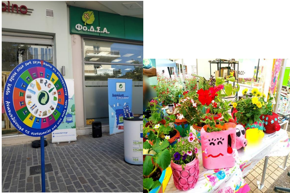
Εικόνες : Από δράσεις – εκδηλώσεις ΦοΔΣΑ Στερεάς Ελλάδας