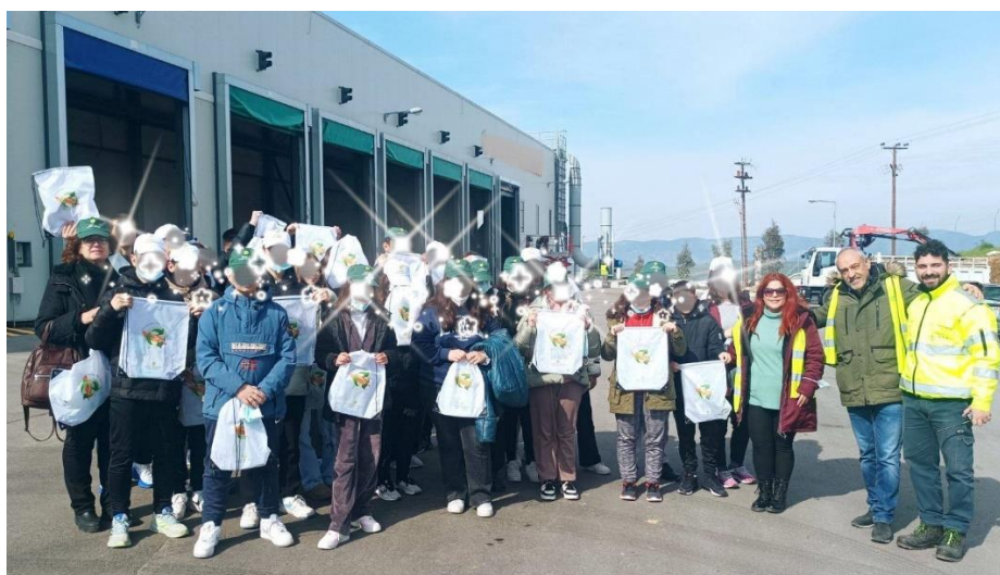
Εικόνες : Επισκέψεις σχολείων στη ΜΕΑ Θήβας