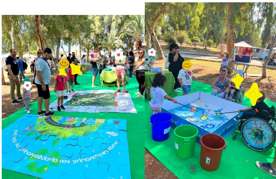
Εικόνες : 1 ο Συμπεριληπτικό Παιδικό Φεστιβάλ (Χαλκίδα, Πάρκο Λαού)

Ο ΦοΔΣΑ Στερεάς Ελλάδας εμπλούτισε τις δράσεις του φεστιβάλ με διάφορα διαδραστικά παιχνίδια για την ανακύκλωση (π.χ. μπάσκετ “το τρίποντο της ανακύκλωσης”, ψάρεμα “ο σκουπιδοψαρούλης”, παζλ, πρασινόπολη, κ.ά.) στο πλαίσιο ενημέρωσης & ευαισθητοποίησης του κοινού σε θέματα προστασίας του περιβάλλοντος, προώθησης των δράσεων κυκλικής οικονομίας, διαλογής στην πηγή και κάθε άλλης πρακτικής φιλικής προς το περιβάλλον.