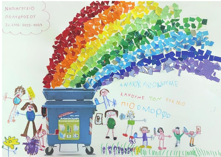
Εικόνα :βραβευμένη κατασκευή

Αντίστοιχος διαγωνισμός “καλύτερου περιβαλλοντικού εκπαιδευτικού παιχνιδιού για τα απορρίμματα” προκηρύχθηκε από τον ΦοΔΣΑ και για το σχολικό έτος 2023 – 2024 , με έπαθλο μία ξενάγηση των μαθητών και των εκπαιδευτικών των βραβευμένων σχολείων στο Αρχαιολογικό Μουσείο Θήβας με πραγματοποίηση παράλληλων περιβαλλοντικών δράσεων στο Άλσος Μοσχοποδίου, καλύπτοντας όλα τα έξοδα της μετακίνησης και της ξενάγησής τους στο Μουσείο.