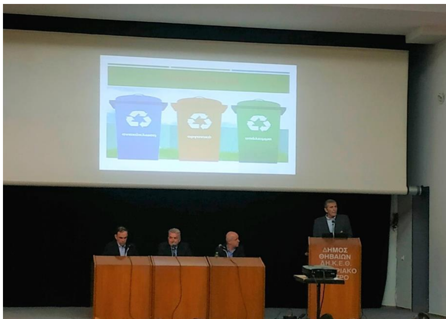
Εικόνα : Ημερίδα για την ανακύκλωση

υπογραμμίζοντας την σημασία της επανεκκίνησης της ανακύκλωσης και της μετάβασης στην κυκλική οικονομία στην Περιφέρεια Στερεάς Ελλάδας.